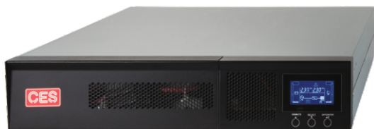
UPS CES GX 1,5 kVA Rack